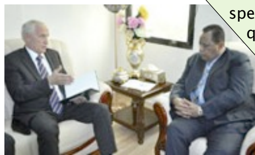
More Page 2

Sudan's Foreign Minister Ibrahim Ghandour and the German Envoy to Sudan and the Nile Basin Countries Rolf Welberts have discussed ways to promote bilateral ties between the two nations in the various fields. Sudan's Foreign Ministry spokesman Gharib Allah said Ghandour has briefed the German envoy on Sudan's efforts to achieve peace in South Sudan and to implement cooperation agreements signed between the two countries.